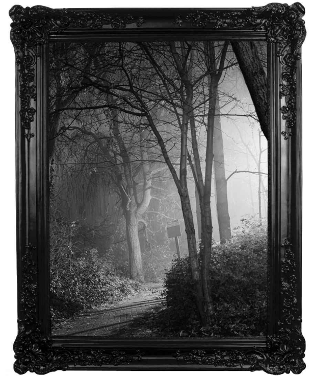
Carlos Aires, The Enchanted Woods IV , from series Happily ever After , 2004, 174 x 142 x 12 cm, digital print on metallic paper between plexiglas and dibond, polyurethane frame. Note: Public "cruising park" where homosexuals and prostitutes have sex, Brussels, Belgium.