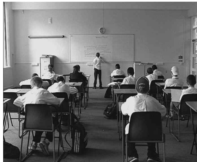
Juan delGado, stills from "don't look under the bed", two screens video installation, 8' 11", 2001.