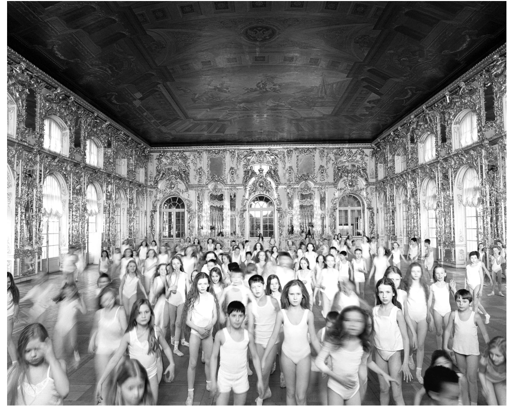
AES+F, King of the Forest, Le roi des aulnes , DVD, 9' 31", 2001.

Eu n-am nevoie de globalizare. Eu am propria mea... mașină o cheamă Dacia și e cea mai frumoasă mașină din lume. Iar pentru asta nu vă trebuie dovezi. Credeți-mă pe cuvânt!