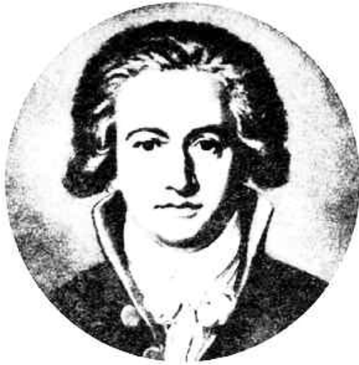
Johann Wolfgang von Goethe

I don't need globalization, I have my own... car is called Dacia and is the most beautiful car in the world.you don't need prove for that.